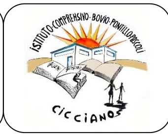
IST. COM.VO CICCIANO "Bovio-Pontillo-Pascoli"