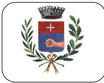
Assessorato P.I. COMUNE DI CICCIANO