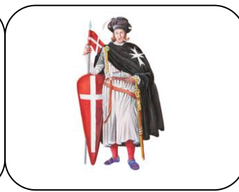
Associazione PRO LOCO CICCIANO