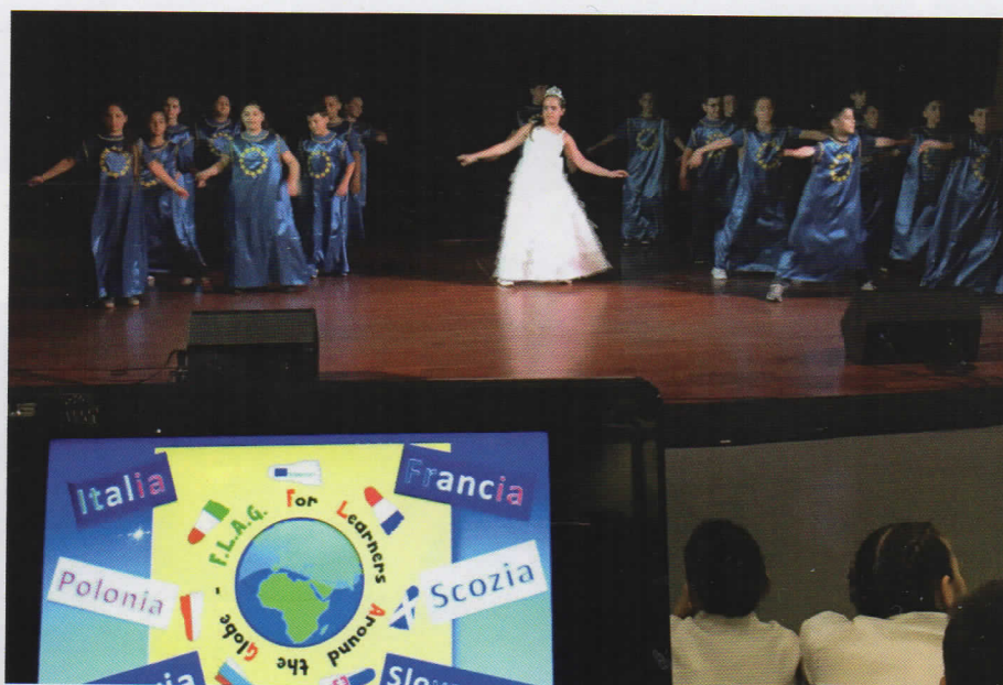
Coreografia: l'Europa siamo noi