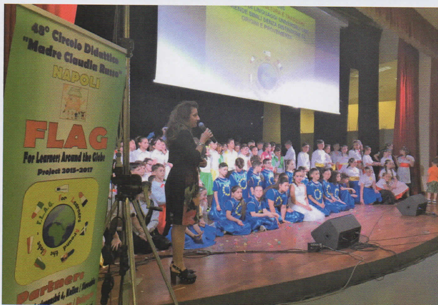
Saluto finale della Dirigente scolastica

Un alunno poi nei panni del nostro presidente del Consiglio