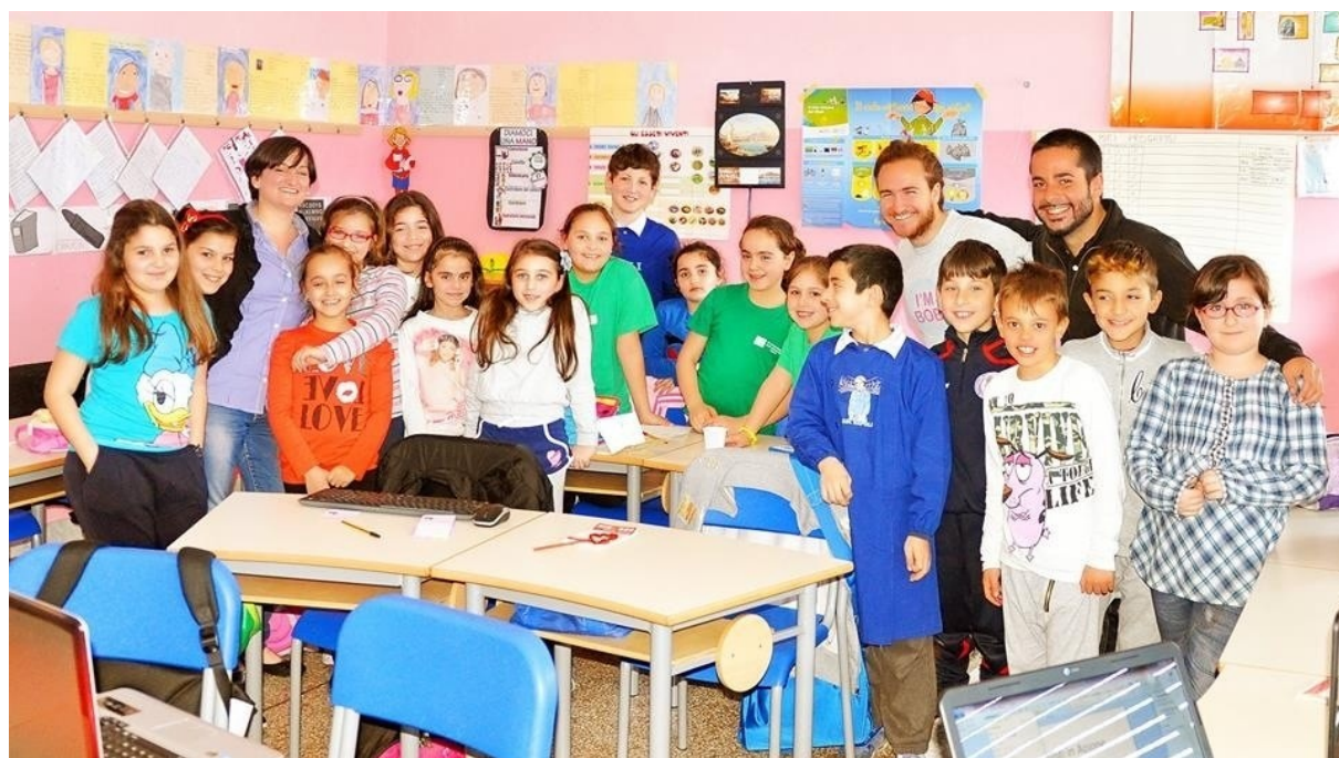
Foto scattata in occasione della visita dei ricercatori LUISS